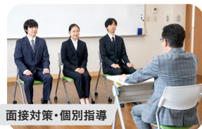
面接対策・個別指導